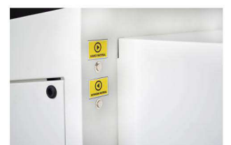
Control de arrastre