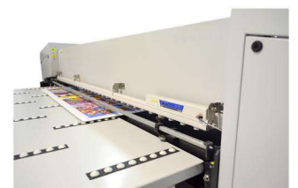
Sistema antiestático opcional