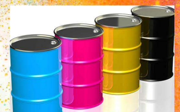
Bajo coste de impresión