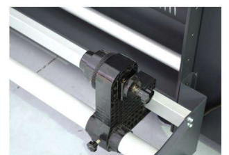
Recogedor y alimentador