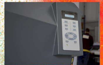
Ready to print (todo incluido)